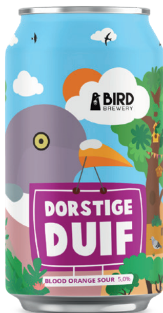
Dorstige Duif BLOOD ORANGE SOUR Vanaf juli 2025