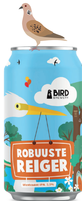
Robuuste Reiger WEST COAST IPA Vanaf maart 2025

We zijn deze vogelcollectie gestart in 2024. Bekijk hier de volledige serie.