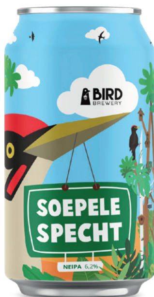
Soepele Specht NEIPA Vanaf mei 2025