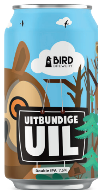
Uitbundige Uil DOUBLE IPA Vanaf september 2025